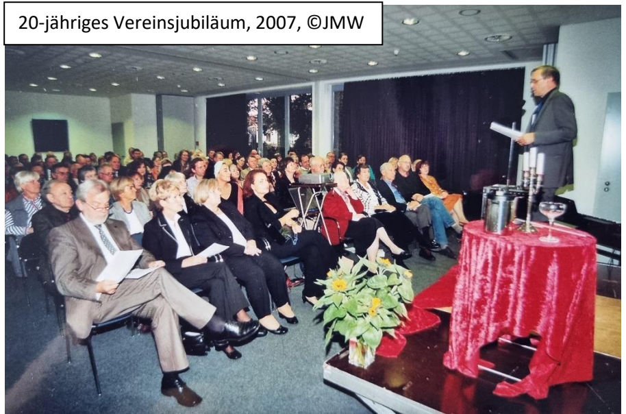
20-jähriges Vereinsjubiläum, 2007